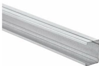
Figure 1: Visuel des profilés du groupe