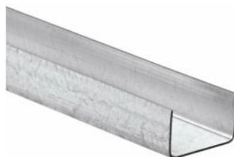
Figure 1: Visuel des profilés du groupe