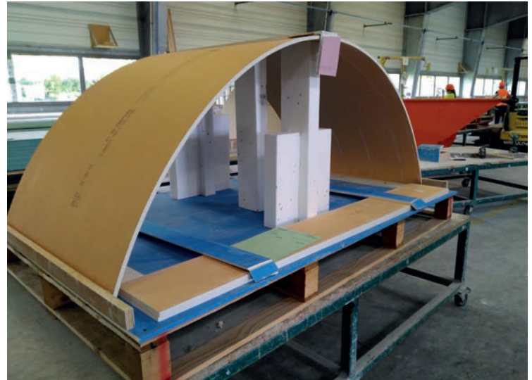
Le système de palettisation des plaques de plâtre cintrées.