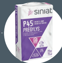
Enduit à joint Siniat (poudre ou prêt à l'emploi)