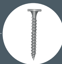
Vis roc 25, 35 et 45 mm