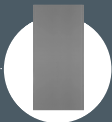
Plaque de plâtre Solidroc® Air